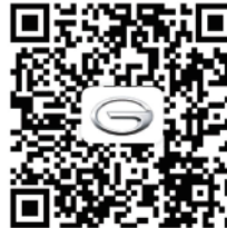
Owner's Manual QR code (Spanish)