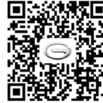
Owner's Manual QR code (Arabic)