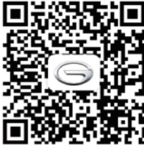
Owner's Manual QR code (English)

GAC MOTOR has fully implemented the Owner's Manual electronically, if you need the complete Owner's Manual , please scan the QR code below to obtain it.